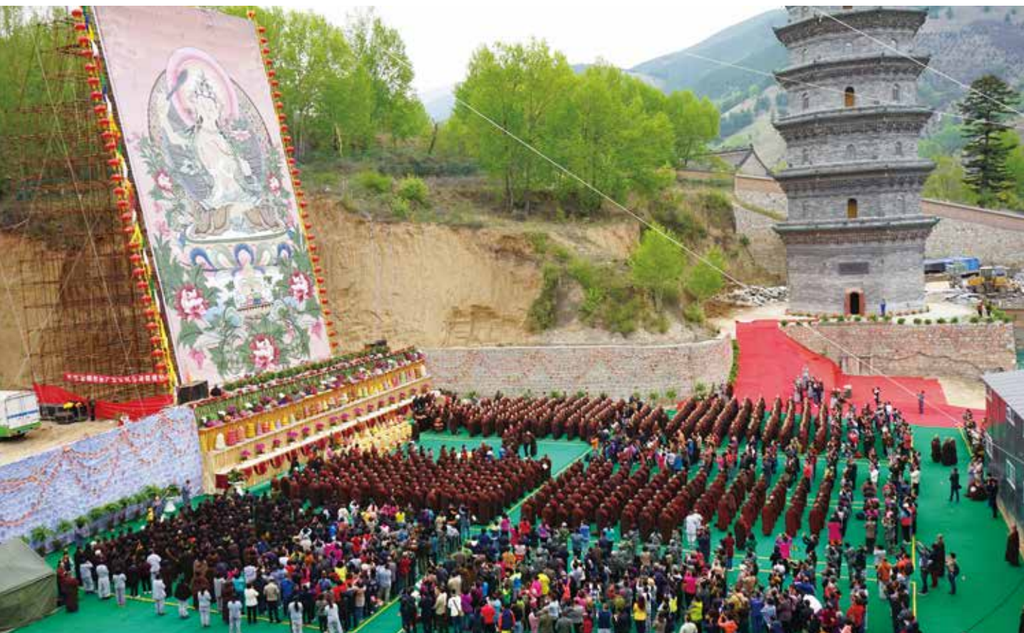
農曆 4 月 4 日文殊菩薩壽誕，普壽寺舉辦了一場數千人的妙吉祥大法會。

我分享了一個最新的《全球宗教景觀》報告，全球 70 億人口，佛教徒僅占 5 億，絕大多數都在中國，仍有一半以上尚待開發。依星雲大師所言，中國佛教發展的希望就在人間佛教，潛力無可限量！