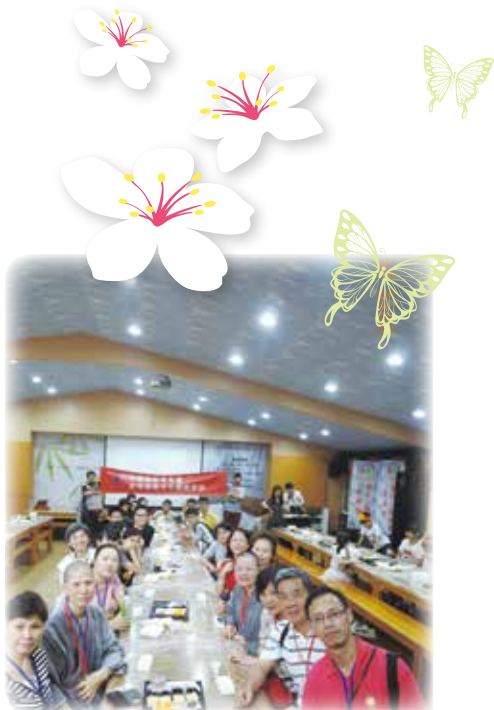
中佛青參訪團在手信坊合影