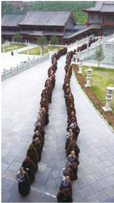
普壽寺比丘尼過堂排班如雁行