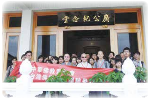
承天禪寺廣公紀念堂前合影

此店具有濃郁的日本風，我們在副店長的導覽下，由一樓室外的櫻花步道漫步進入室內，聆聽著日本的節令禮俗，參觀古早的製菓模具