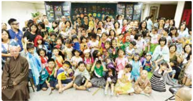
2015年佛青舉辦「歡暑奇緣」兒童藝術營