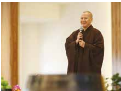
理事長明毓法師致詞