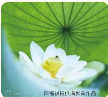
陳福祺提供攝影荷作品